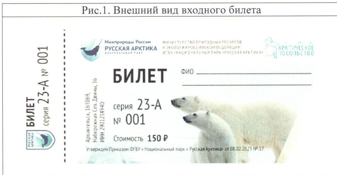
Рис.1. Внешний вид входного билета