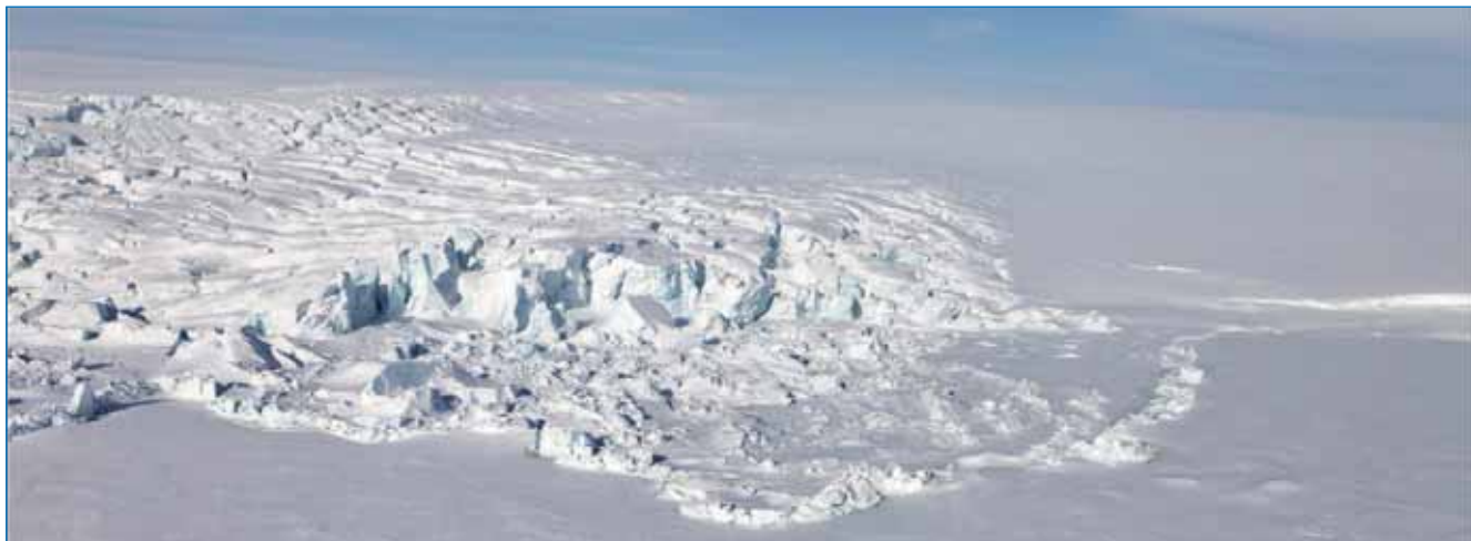
Карское море с высоты птичьего полета.

За четыре летних дня участники экспедиции преодолели на вертолетах более 5000 километров, обследовали побережье островов и прилежащие акватории, в т.ч. полыньи у восточного побережья Северной Земли. Маршруты полетов прокладывались с учетом ледовой обстановки по оперативным данным, предоставленным ААНИИ.