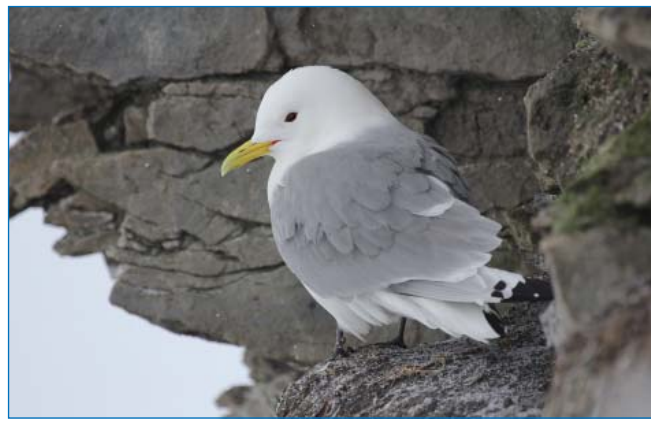
Моевка на колонии мыса Кользат, о. Грезм-Белл.

Всего в ходе экспедиционных работ в апреле–мае на территории заказника «Земля Франца-Иосифа» и прилегающих ледовитых акваториях было отмечено девять видов птиц и шесть видов млекопитающих. В начале июня видовое разнообразие птиц заметно увеличи-