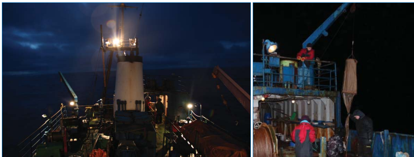
НИС «Дальние Зеленцы» на Кольском разрезе в полярную ночь (слева) и отбор проб зоопланктона (справа).

численность и биомасса основных систематических групп и видов, пространственное и вертикальное распределение, плотность распределения, продукционные характеристики основных видов (групп) «кормового» зоопланктона; дополнительно на трех станциях (ст. 11, 14 и 19) были отобраны пробы воды для генетического анализа зоопланктона (самки Calanus spp. ). Пробы были профильтрованы через сито с ячейей 168 мкм и зафиксированы 96-процентным этиловым спиртом, через 24 и 48 ч пробы заново фильтровали и повторно фиксировали спиртом);