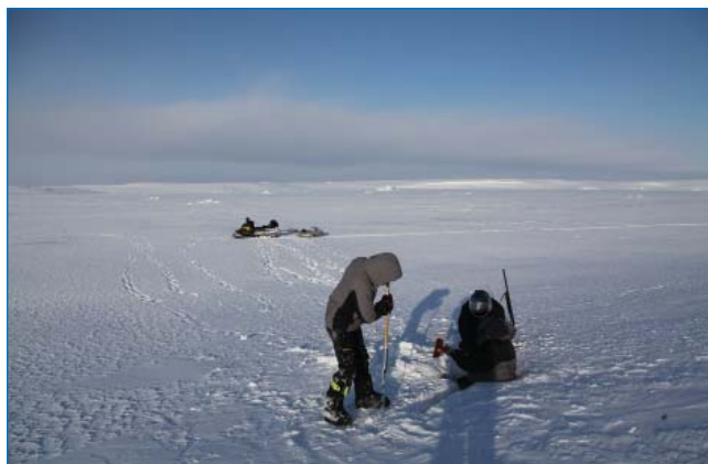
Обследование логова нерпы.

7–8 апреля после понижения температуры ниже –20 °С и ветров нажимного характера площадь полыньи сильно сократилась, она заполнилась ниласовыми льдами и нагнанным ветром льдинами. По наблюдениям с мыса Нимрод на сохранившихся небольших участках чистой воды отмечены стаи кайр и люриков до сотни и более особей, многочисленные кайры вереницами перелетали в южном и юго-западном направлении в сторону мыса Мери Хармсуорт, где сохранились пространства открытой воды. Среди ниласовых льдов в течение