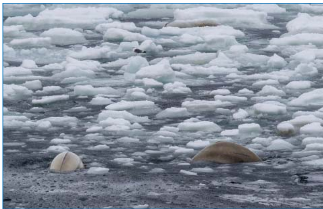
Белухи у ледовой кромки.

Ледовая кромка. В период наших наблюдений, в середине мая, зона кромки дрейфующих льдов располагалась к югу от ЗФИ, примерно на широте 75° 20' с.ш. На дрейфующих льдах и в разводьях были встречены нерпы и морские зайцы, моржи. В районе 79° с.ш. в зоне сплоченных льдов до 8–9 баллов наблюдалась концентрация медвежьих следов, а также медведи – одиночный зверь и самка с медвежонком. Из наиболее интересных наблюдений следует отметить небольшое стадо белух в разводье среди льдов, а также стайки обыкновенных гаг. В разводьях среди льдов кормились многочисленные кайры и люрики, чистики и моевки, глупыши, бургомистры, белые чайки. В начале июня между ЗФИ и Новой Землей у внешней кромки дрейфующих льдов (на широте 78° с.ш.) регулярно наблюдались белухи с детенышами, также встречен одиночный гренландский кит. Здесь же держались стаи кормящихся моек и полярных крачек. На кромке льдов к северо-западу от острова Нортбрук отмечено скопление моржей, в т.ч. самки с новорожденными детенышами. Также скопление моржей обнаружено на кромке льдов в зал. Русская Гавань и в районе Больших Оранских островов (Новая Земля). В Русской Гавани у туши добытого моржа скопилась группа белых медведей (взрослый самец, самка с двумя сеголетками, два одиночных медведя).