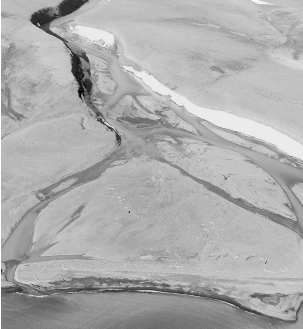
Рис. 10. Аккумуляция аллювия в устье реки на северо-восточном побережье о-ва Северный.

облик устьевых участков. При этом ни один даже самый полноводный поток не создает дельту, вдающуюся в море. Аккумулятивные формы речных наносов образуются только в пределах расширенного приустьевых участка речной долины или в лагуне и всегда отгорожены от моря современной морской косой. Судя по положению плавниковой древесины, некоторые бывшие лагуны и теперь частично затапливаются высокими приливами.