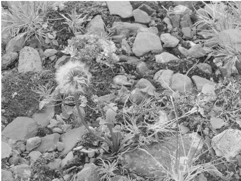
Рис. 3. Растительная группировка дренированной фации полярной пустыни (район наземного обследования № 1).