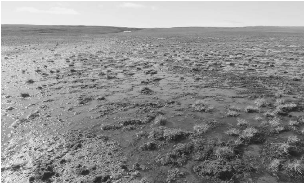
Рис. 5. Обводненный участок с относительно сомкнутой травяно-моховой растительностью на днище обмелевшей лагуны в заливе Аварийный (район наземных наблюдений № 3).

здесь оказываются полностью переработанными (рис. 6). Не все мысы имеют абразионное происхождение, единично встречаются мелкие выступы морского берега, представляющие собой формы прибрежно-морской аккумуляции.