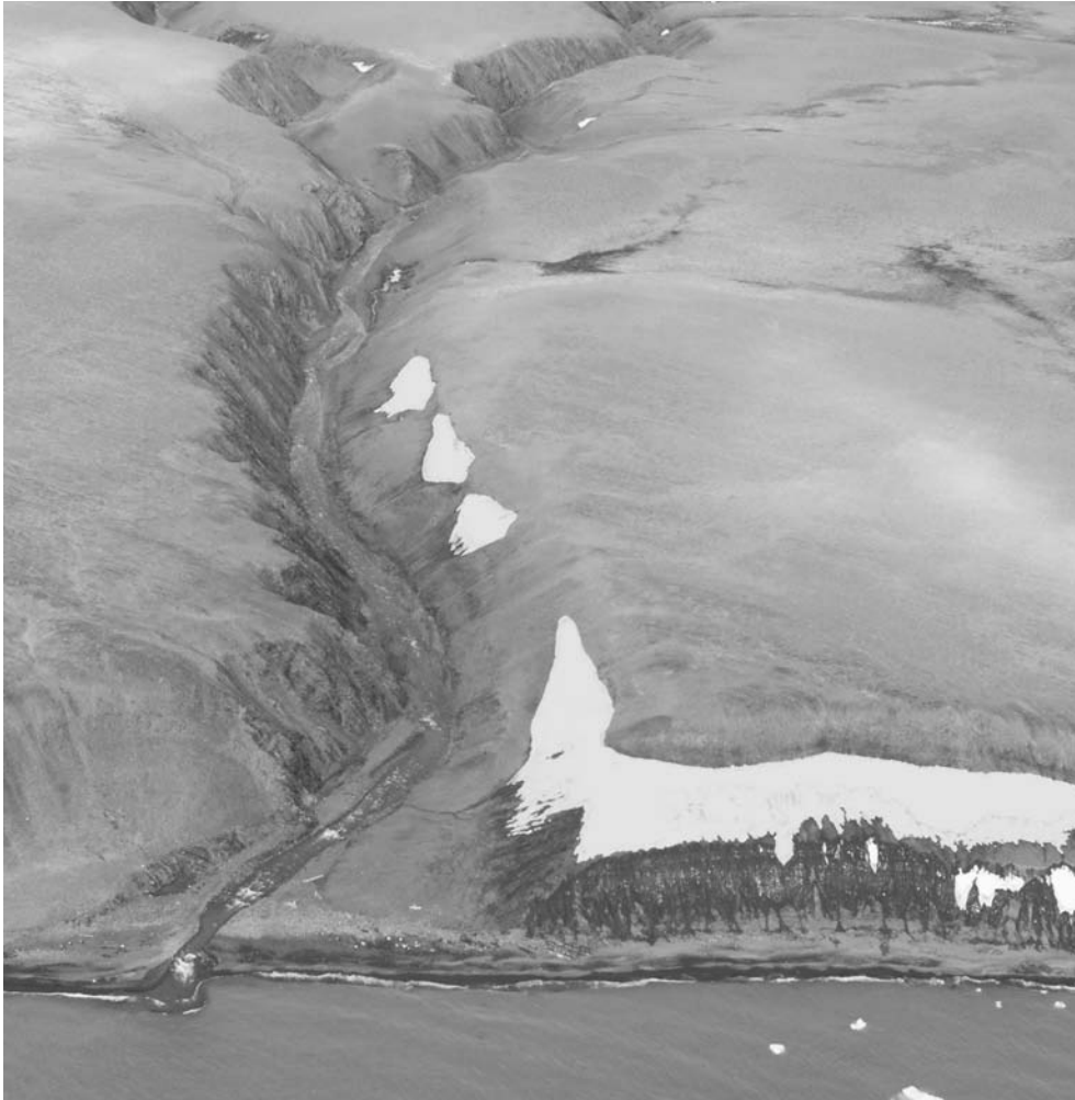
Рис. 9. Речная долина с V-образным поперечным профилем на абразионном участке северо-восточного побережья о-ва Северный.

имеют ступенчатый, невыработанный продольный профиль: эрозионные участки чередуются с аккумулятивными, последние бывают представлены даже внутренними дельтами. Сравнительно короткие русловые формы, не достигающие своими верховьями до ледников, в нижнем течении имеют V-образный поперечный профиль. Здесь проявляется преимущественно глубинная эрозия. Такие долины, часто заполненные многолетними снежниками, открываются на абразионных участках морского берега (рис. 9).