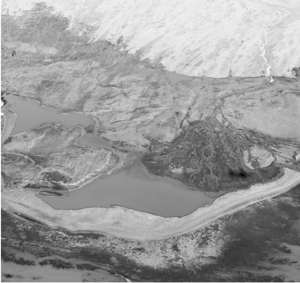
Рис. 11. Конечная морена на морском берегу у края ледника Средний, северо-восточное побережье о-ва Северный.

скольких километров. Накопление аллювия, грубообломочного по своему составу, в нижнем течении могло быть обусловлено более высоким в прошлом подпором со стороны моря. В настоящее время река размывает отложения и рельеф, созданные в прошлом прибрежно-морской аккумуляцией (днище лагуны, древний аккумулятивный вал, старый пляж), замещая их своими наносами.