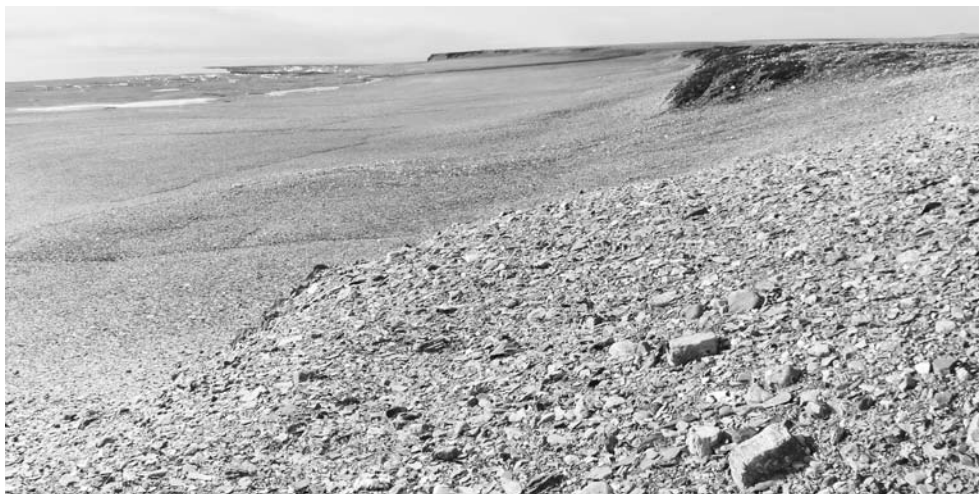
Рис. 7. «Старый берег»: пляж и ближайший к морю береговой уступ, не подверженные современной волноприбойной деятельности в «оазисе» между ледниками Вершинского и Рождественского (район наземного обследования № 1).

Эти склоны, как и полоса, примыкающая непосредственно к урезу воды, сложены обломками скальных пород размером до глыб, как окатанными, так и неокатанными. Везде разбросана плавниковая древесина. Вместе с тем эти поверхности резко отличаются друг от друга. Если облик современного пляжа свидетельствует о том, что его отложения постоянно перерабатываются морскими волнами, то на склоне, непосредственно примыкающем к подножию первого прибрежного уступа, несмотря на признаки его затопления во время приливов, уже вполне ясно проявляют себя процессы, свойственные геокомплексам полярной пустыни: морозобойное растрескивание, эрозионная деятельность поверхностного стока, редкое расселение растительности.