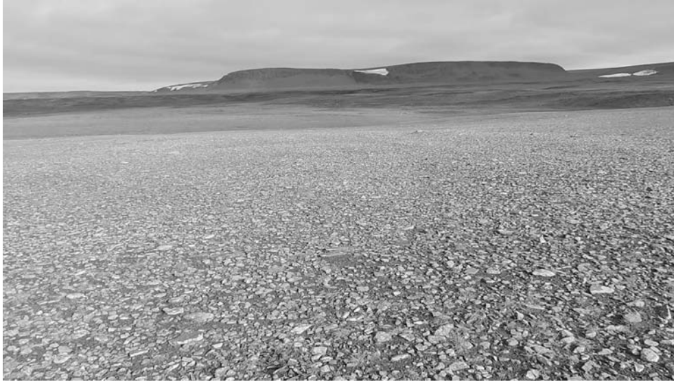
Рис. 2. Дренированная фация полярной пустыни на водоразделе в «оазисе» между ледниками Вершинского и Рождественского (район наземного обследования № 1).