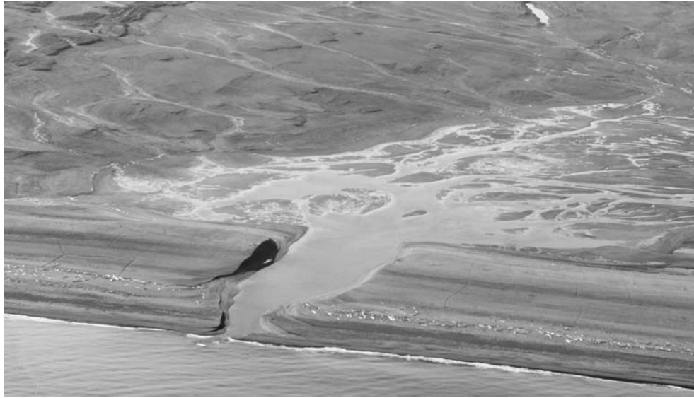
Рис. 8. Древний аккумуляторный вал на северо-восточном побережье о-ва Северный, размытый в устье реки.

Морозобойные трещины здесь имеют вид полигональных ложбин глубиной до 1 м со следами водного перемещения тонкодисперсной фракции грунта. По всей видимости, здесь фации полярной пустыни развиваются на бывших морских пляжах, которые в настоящее время вышли из-под влияния волноприбойной деятельности.