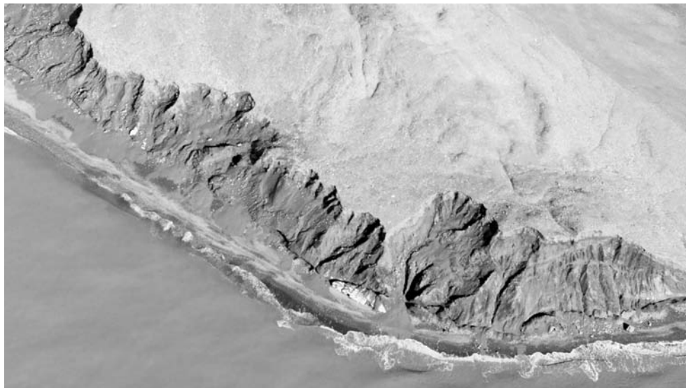
Рис. 6. Оползневые цирки, «разъедающие» абразионный уступ на северо-восточном берегу о-ва Северный, в 2—3 км к востоку от ледника Рождественского.

При низком уровне воды осушаются современные морские пляжи и косы (рис. 4). Их отложения — крупные обломки, более или менее окатанные, сме-