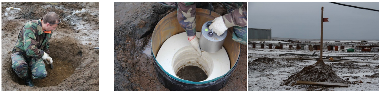
Рисунок 1 – Установка сейсмометра SMG-40T (станция ZFI2) в сентябре 2011 г. на о. Земля Александры архипелага Земля Франца-Иосифа

погранзаставы «Нагурское» сотрудниками ФИЦКИА УрО РАН был открыт самый северный пункт сейсмических наблюдений в России, оснащенный сейсмологическим оборудованием мирового уровня. В 2015 г. на базе «Омега» национального парка «Русская Арктика» была установлена дополнительная сейсмическая станция на удалении 2.5 км от первой [Antonovskaya et al, 2020]. В результате работы сейсмических станций нам стали доступны новые уникальные данные, например, о сейсмичности шельфовых территорий Баренцева и Карского морей, роевой сейсмичности на хребте Гаккеля, что ранее было просто невозможно. Процесс установки аппаратуры в пункте сейсмических наблюдений на архипелаге Земля Франца-Иосифа показан на рисунке 1.